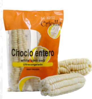
Choclo entero 650 g / Caja x 15 CCH005