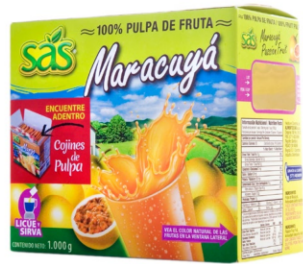
Pulpa de maracuyá 10 uds x 100g / Caja x 12 CPU019