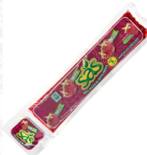
Pulpa de mora 230 g / Caja x 40 CPU024