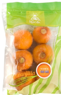
Lulo entero 500 g / Caja x 24 CFR004