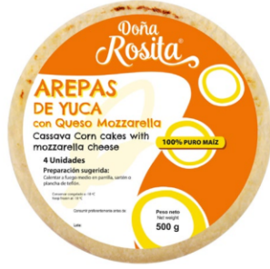
Arepas de yuca con queso Mozzarella 500 g (4 uds) / Caja x 24 CAR006