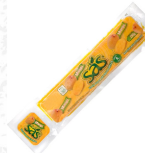
Pulpa de mango 230 g / Caja x 40 CPU016