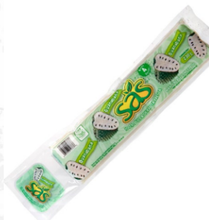
Pulpa de guanábana 230 g / Caja x 40 CPU008