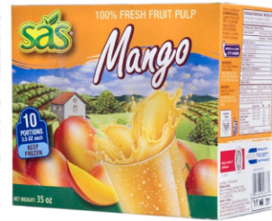
Pulpa de mango 10 uds x 100g / Caja x 12 CPU015