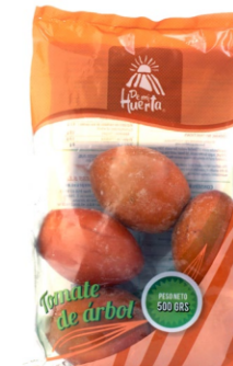
Tomate de árbol 500 g / Caja x 24 CFR007