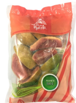
Guayaba en trozos 500 g / Caja x 24 CFR003