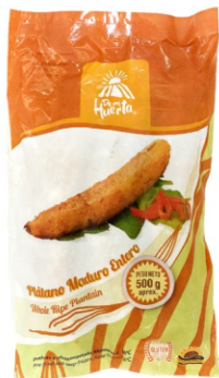
Plátano maduro entero 500 g / Caja x 24 CPL003