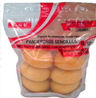
Doypack pandebonos 6 uds (45 g) / Caja x 14 CPA050