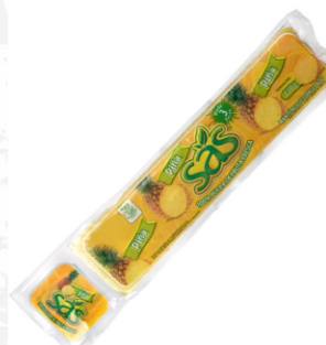
Pulpa de tomate de árbol 230 g / Caja x 40 CPU028