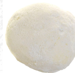
Pandebono crudo 65 g / Caja x 120 CPA014