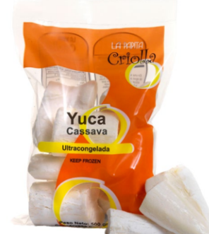
Yuca cruda en trozos 500 g / Caja x 27 CYU003