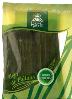
Hoja de plátano 500 g / Caja x 16 CPL001