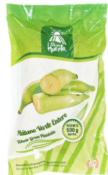
Plátano verde entero 500 g / Caja x 24 CPL004