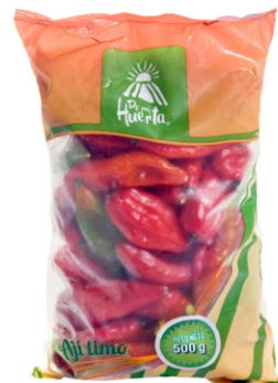
Ají limo 500 g / Caja x 12 CAJ002