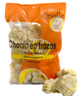
Choclo en trozos 500 g / Caja x 20 CCH002