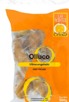
Olluco picado 500 g / Caja x 20 CPP003