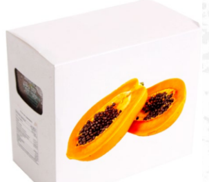
Pulpa de Papaya 10 uds x 100g / Caja x 12 CPU025