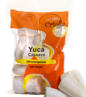
Yuca cruda en trozos 500 g / Caja x 24 CYU002