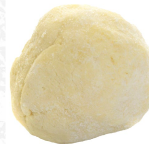
Almojabana cruda 65 g / Caja x 120 CPA001