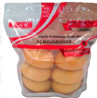
Doypack almojabanas 6 uds (45 g) / Caja x 14 CPA054

Recomendamos calentar en un Horno Convencional. Dejar descongelar durante 40min y calentar durante 10 a 15 minutos a 150°