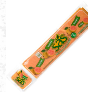
Pulpa de guayaba 230 g / Caja x 40 CPU009