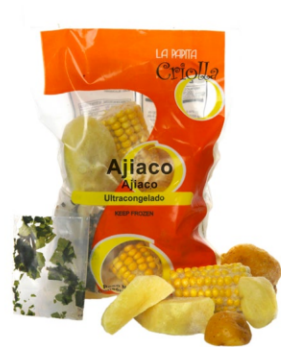
Ajiaco 1 kg / Caja x 12 CVA001