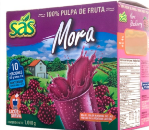
Pulpa de mora 10 uds x 100g / Caja x 12 CPU023