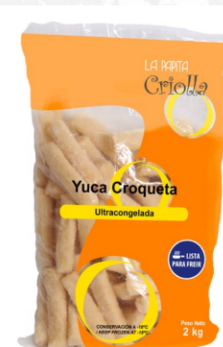
Yuca fries 2 kg / Caja x 6 CYU005