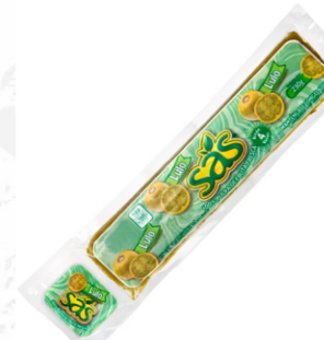
Pulpa de lulo / naranjilla 230 g / Caja x 40 CPU012