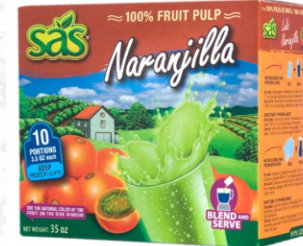
Pulpa de lulo / naranja 10 uds x 100g / Caja x 12 CPU011