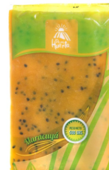
Maracuyá con semilla 500 g / Caja x 24 CFR005