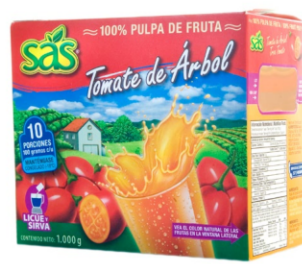
Pulpa de tomate de árbol 10 uds x 100g / Caja x 12 CPU030