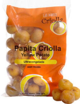
Papa criolla 500 g / Caja x 24 CPP001