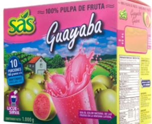
Pulpa de Guayaba 10 uds x 100g / Caja x 12 CPU010