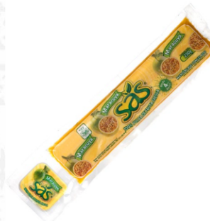
Pulpa de maracuyá 230 g / Caja x 40 CPU022