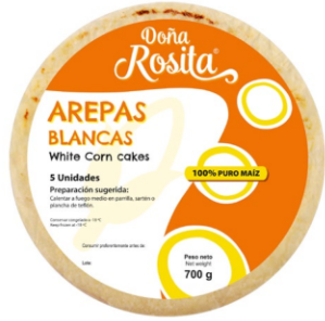
Arepas blancas 500 g (6 uds) / Caja x 24 CAR008