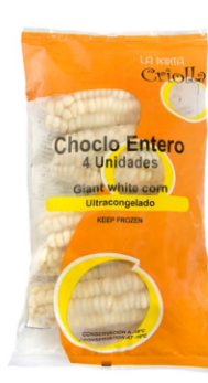
Choclo entero 4 uds / Caja x 10 CCH004