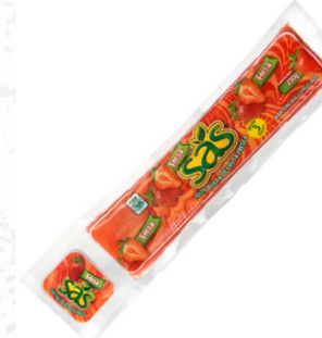
Pulpa de fresa 230 g / Caja x 40 CPU003