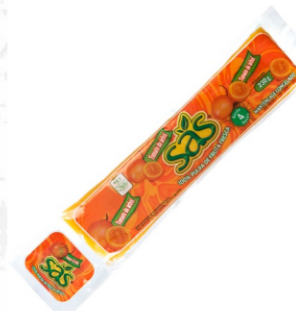
Pulpa de tomate de árbol 230 g / Caja x 40 CPU031