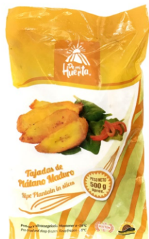
Tajadas de plátano maduro 500 g / Caja x 24 CPL005