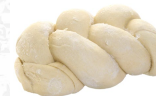
Trenza de queso 370 g / Caja x 20 CPA013