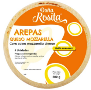
Arepas con queso Mozzarella 500 g (4 uds) / Caja x 24 CAR002