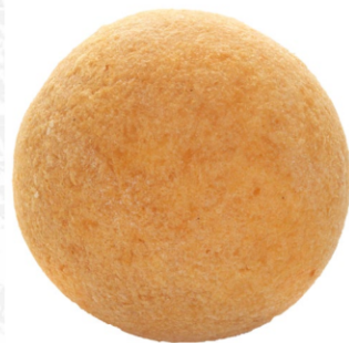
Buñelo granel 80 g / Caja x 42 CPA004