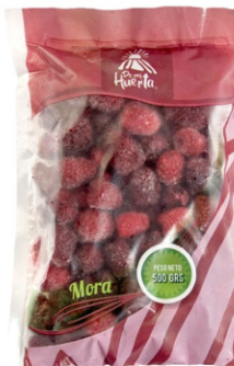
Mora entera 500 g / Caja x 24 CFR006