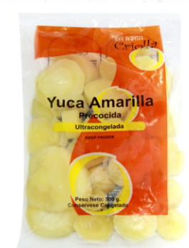
Yuca amarilla 500 g / Caja x 24 CYU001