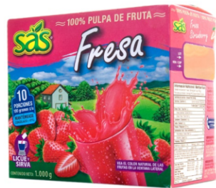
Pulpa de fresa 10 uds x 100g / Caja x 12 CPU002