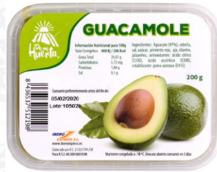
Guacamole 200 g / Caja x 32 CVA002