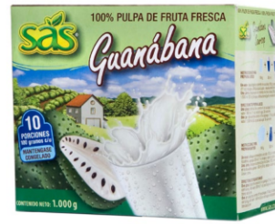
Pulpa de guanábana 10 uds x 100g / Caja x 12 CPU006