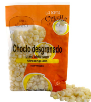
Choclo desgranado 500 g / Caja x 30 CCH001