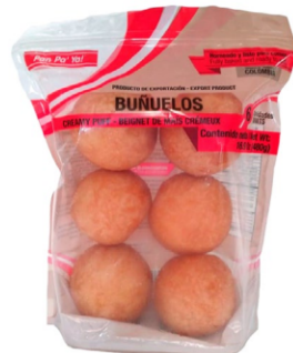
Doypack buñuelos 6 uds (65 g) / Caja x 8 CPA053