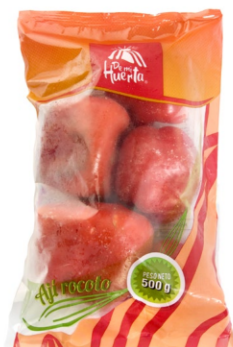
Ají rocoto 500 g / Caja x 15 CAJ003