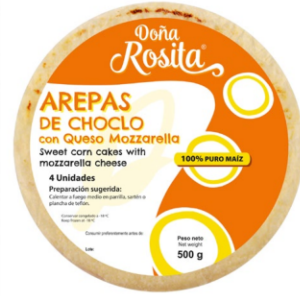
Arepas de choclo con queso Mozzarella 500 g (4 uds) / Caja x 24 CAR003