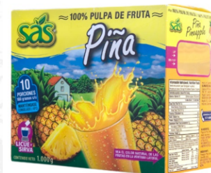
Pulpa de piña 10 uds x 100g / Caja x 12 CPU027