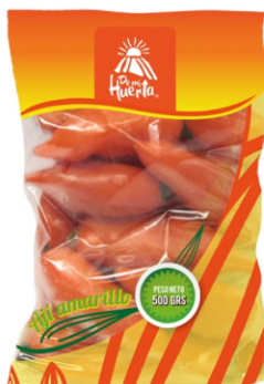
Ají amarillo 500 g / Caja x 15 CAJ001