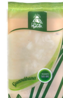
Guanábana en mota 500 g / Caja x 24 CFR002