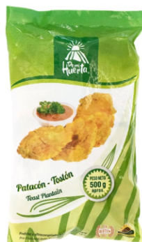
Plátano prefrito 500 g / Caja x 24 CPL002